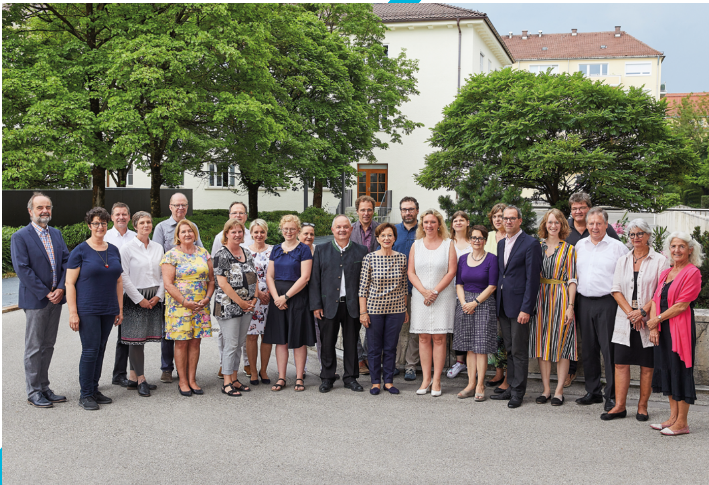
Kuratorium 2019