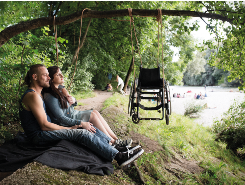
Foto oben: Teil der Ausstellung „Selbstbestimmt! Was heißt hier Inklusion?“

Im Rahmen des MünchnerStiftungsFrühlings fanden zwei dezentrale Veranstaltungen in Kooperation mit der Stiftung Gute-Tat und der Versicherungskammer Stiftung statt: