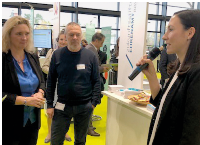
Foto oben: Messerundgang der Bayr. Sozialministerin Kerstin Schreyer, MdL, am Stand der Zukunftsstiftung Ehrenamt Bayern