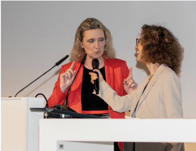
Kerstin Schreyer, MdL, Bayerische Staatsministerin für Familie, Arbeit und Soziales und Vorstandsvorsitzende der Zukunftsstiftung Ehrenamt Bayern im Gespräch mit Moderatorin Sybille Giel, Bayern 2, bei der Eröffnungsveranstaltung am 23. März 2019